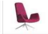
MYPLACE | Poltrona con braccioli