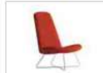
MYPLACE | Poltrona