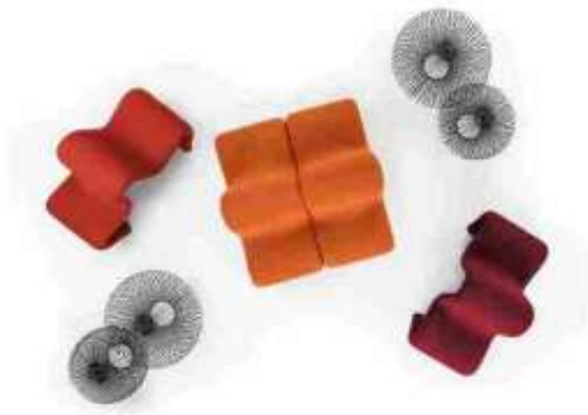
DOS À DOS LOUVRE