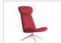
MYPLACE | Poltrona a 4 razze