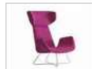
MYPLACE | Poltrona a orecchioni