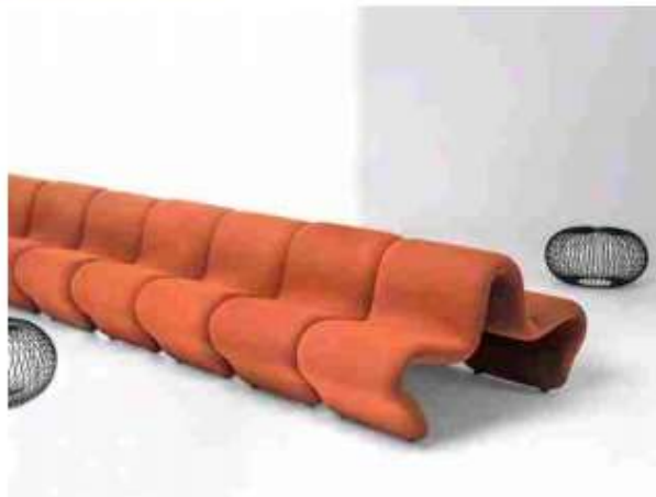
DOS A DOS LOUVRE