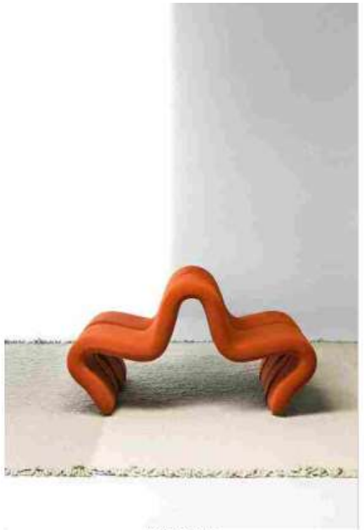
DOS À DOS LOUVRE