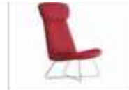
MYPLACE | Poltrona con poggiatesta