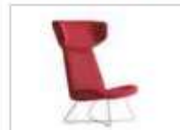
MYPLACE | Poltrona a orecchioni