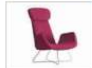
MYPLACE | Poltrona con braccioli