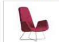
MYPLACE | Poltrona con braccioli