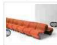
DOS A DOS LOUVRE