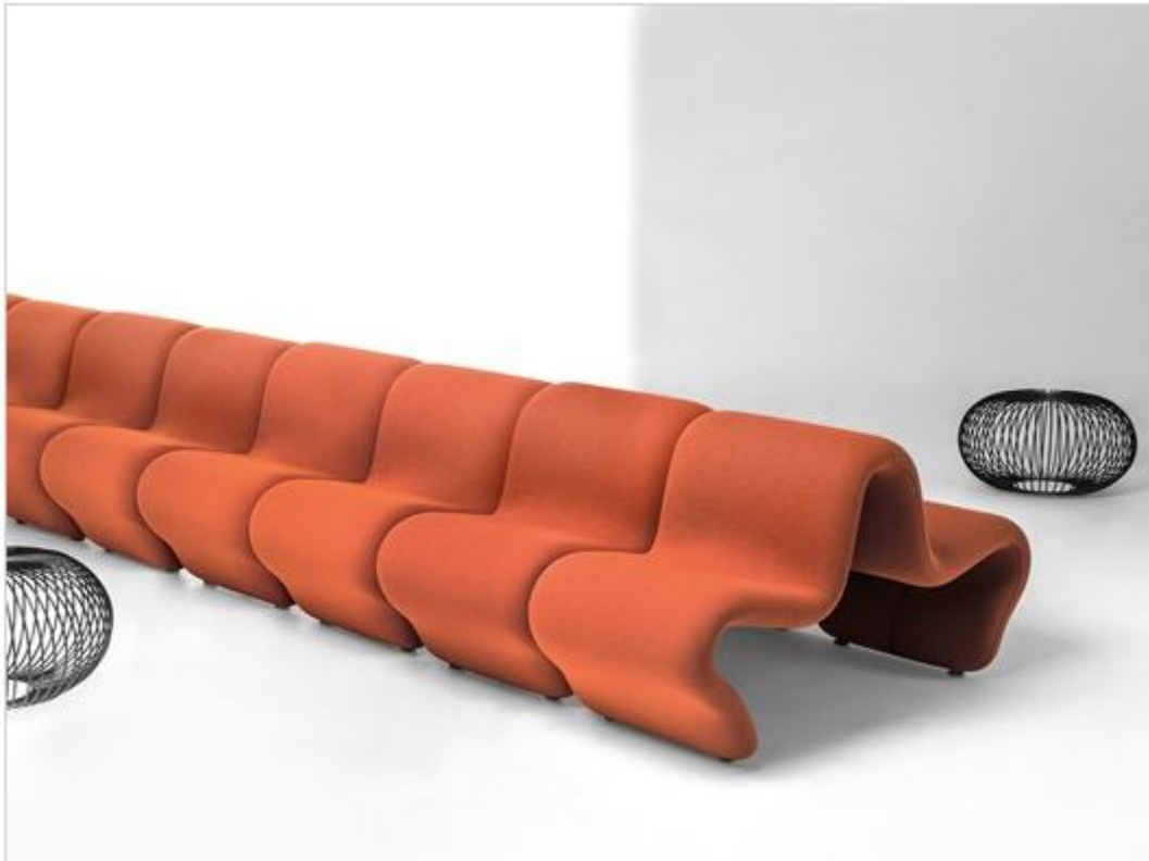
Dos à Dos Louvre