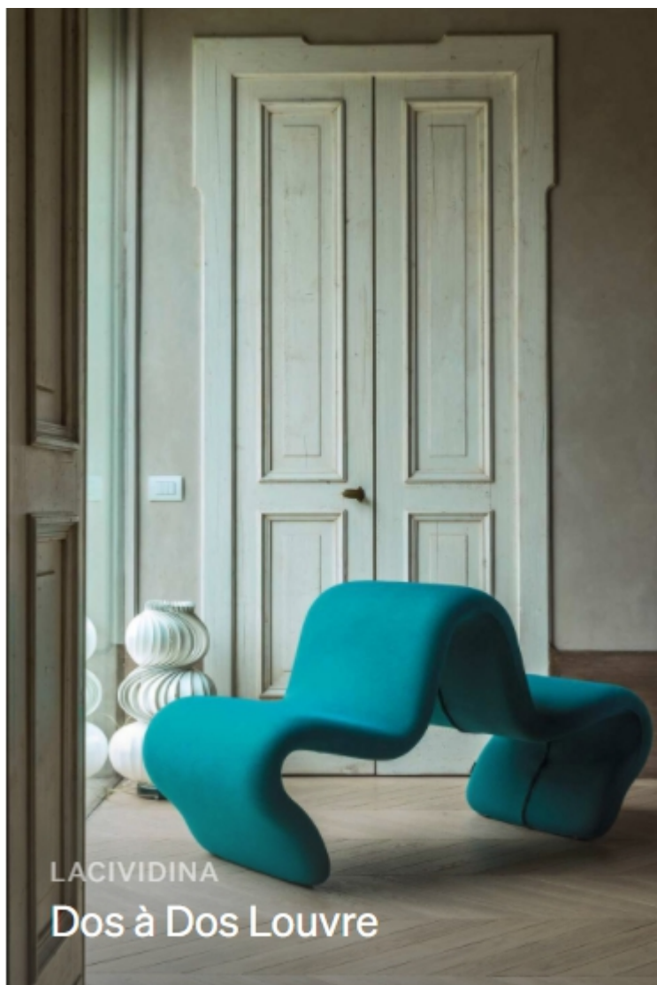
LACIVIDINA Dos à Dos Louvre

Parmi ceux-ci, Mushroom d'Artifort, défini par le designer comme "le meilleur objet industriel qu'il ait jamais conçu". Laissons maintenant parler ses créations, laissez-vous inspirer par la sélection de Pierre Paulin.